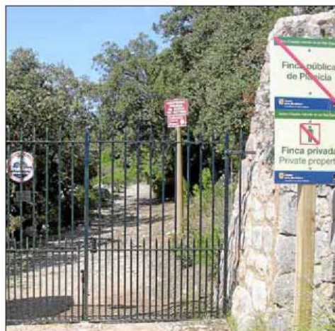
Acceso cerrado del Camí Vell de Planícia.

Pero es que, además, los propietarios de es Rafal también han decidido