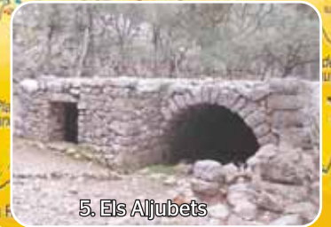
5. Els Aljubets