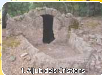
1. Aljub dels Cristians