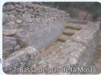
7. Bassa del pas de la Mola