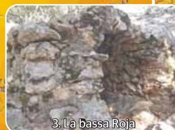
3. La bassa Roja