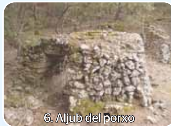
6. Aljub del porxo