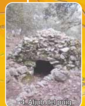
4. Aljub del puig

El camí del pas de la Mola és una via molt bella que n'inclou una de ferradura amb tot un seguit de revolts amb marges