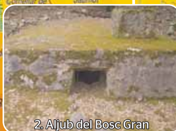
2. Aljub del Bosc Gran